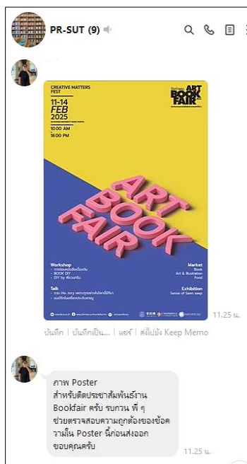
ภาพที่ 5 การส่งข้อมูลเพื่อตรวจสอบในทีมประชาสัมพันธ์ก่อนพิมพ์

3. เมื่อต้องการพิมพ์เอกสาร บุคลากรดำเนินการตรวจสอบความถูกต้องก่อนสั่งพิมพ์ และสำหรับงานพิมพ์ประชาสัมพันธ์ มีการตั้งกลุ่ม Line ทีมตรวจสอบก่อนประชาสัมพันธ์เพื่อลดการสูญเสียกระดาษ