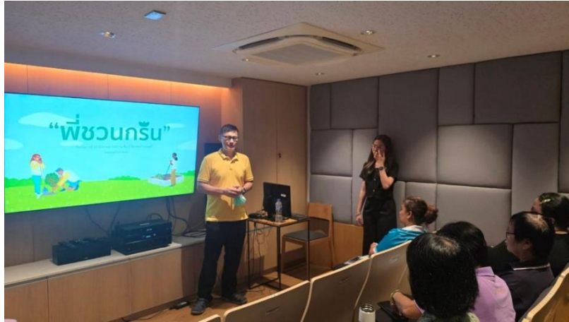
ภาพที่ 1 การประชุมและจัดกิจกรรมสื่อสารให้บุคลากรรับทราบมาตรการการใช้กระดาษ/หมึกพิมพ์

1. การประชาสัมพันธ์นโยบายและมาตรการการใช้กระดาษ /หมึกพิมพ์ ผ่านการประชุมบุคลากรหอสมุด วังท่าพระและประชาสัมพันธ์ที่เผยแพร่ผ่านทางเว็บไซต์, Facebook,