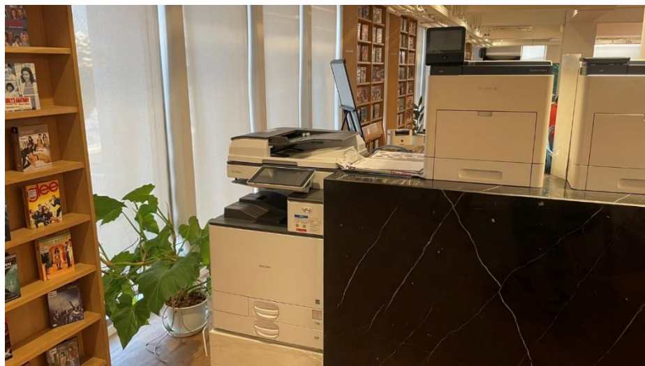
ภาพที่ 6 เครื่องพิมพ์มีการบำรุงรักษาให้พร้อมใช้งานอยู่เสมอ

4. มีการบำรุงรักษาเครื่องพิมพ์และเครื่องถ่ายเอกสารอย่างสม่ำเสมอ เพื่อลดการสูญเสียกระดาษ