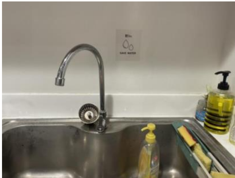
ภาพที่ 2 การติดป้ายประชาสัมพันธ์ยังจุดใช้น้ำของหอสมุด