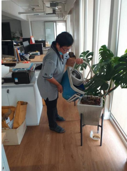
ภาพที่ 7 นำน้ำจากการทำความสะอาดมารดน้ำต้นไม้

6. หอสมุดวังท่าพระนำน้ำที่เหลือจากการกิจกรรมต่าง ๆ มาใช้ซ้ำ คือการนำน้ำจากการทำความสะอาดมาใช้รดน้ำต้นไม้