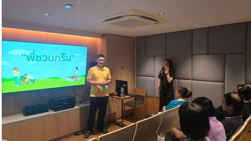
ภาพที่ 1 การประชุมและจัดกิจกรรมสื่อสารให้บุคลากรรับทราบมาตรการประหยัดน้ำ