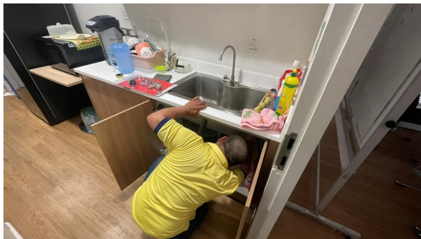
ภาพที่ 8 การซ่อมแซมอุปกรณ์เมื่อชำรุดทันที

7. หอสมุดวังท่าพระดำเนินการแจ้งผู้เกี่ยวข้องเพื่อดำเนินการซ่อมแซมหากอุปกรณ์ประปาหรือสุขภัณฑ์ชำรุด