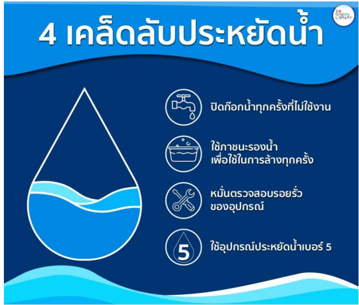
ภาพที่ 3 การประชาสัมพันธ์ให้ความรู้ในการประหยัดน้ำ

2. สำรรวจอุปกรณ์ ถึงกับน้ำและบ่อน้ำประปา ปีละ 1 ครั้ง พร้อมบันทึกผลการสำรวจ หอสมุดวังท่าพระมีการใช้อุปกรณ์น้ำปะปาพร้อมกับส่วนตึกอธิการบดีมหาวิทยาลัย อุปกรณ์จึงถูกสำรวจ และดูแลโดยมหาวิทยาลัยศิลปากร วิทยาเขตวังท่าพระ มีเพียงอุปกรณ์น้ำปะปาในครัวเพียง 1 จุดที่หอสมุดวังท่า พระดำเนินการสำรวจแต่ไม่ได้จดบันทึก