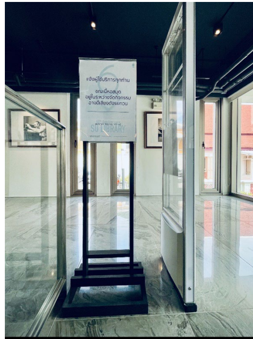
ภาพป้ายประชาสัมพันธ์แจ้งให้ผู้ใช้บริการทราบ