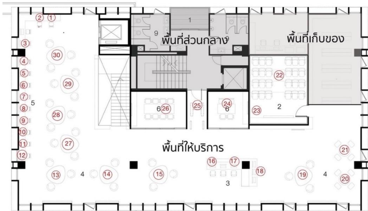
ผังแสดงจุดตรวจวัดระดับความเข้มของพื้นที่ชั้น 3 หอสมุด วังท่าพระ