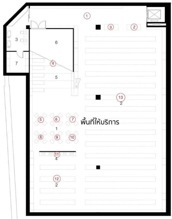
ผังแสดงจุดตรวจวัดระดับความเข้มของพื้นที่ชั้น G หอสมุด วังท่าพระ