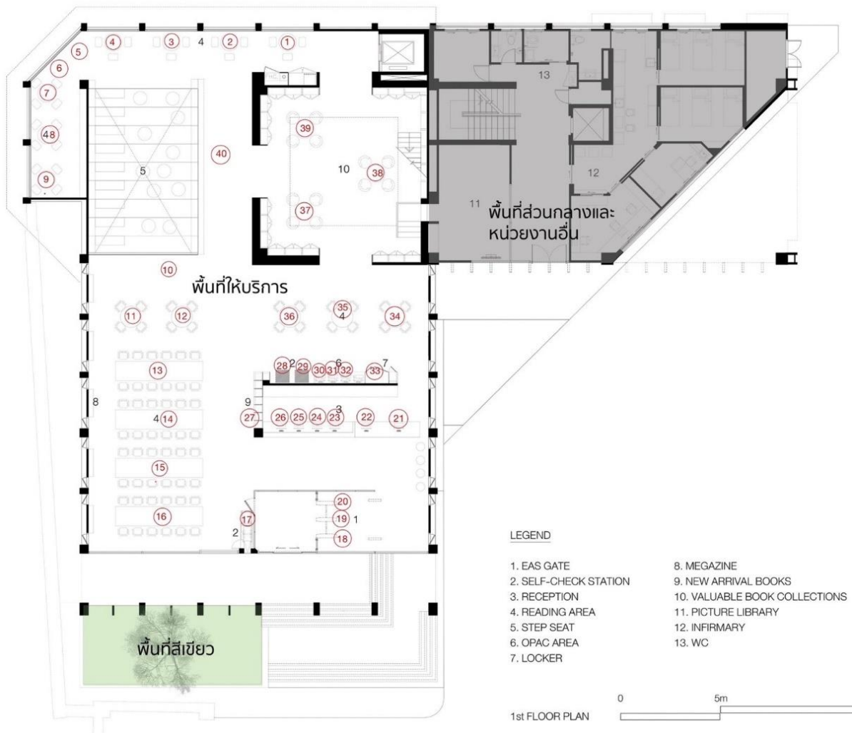
ผังแสดงจุดตรวจวัดระดับความเข้มของพื้นที่ชั้น 1 หอสมุด วังท่าพระ