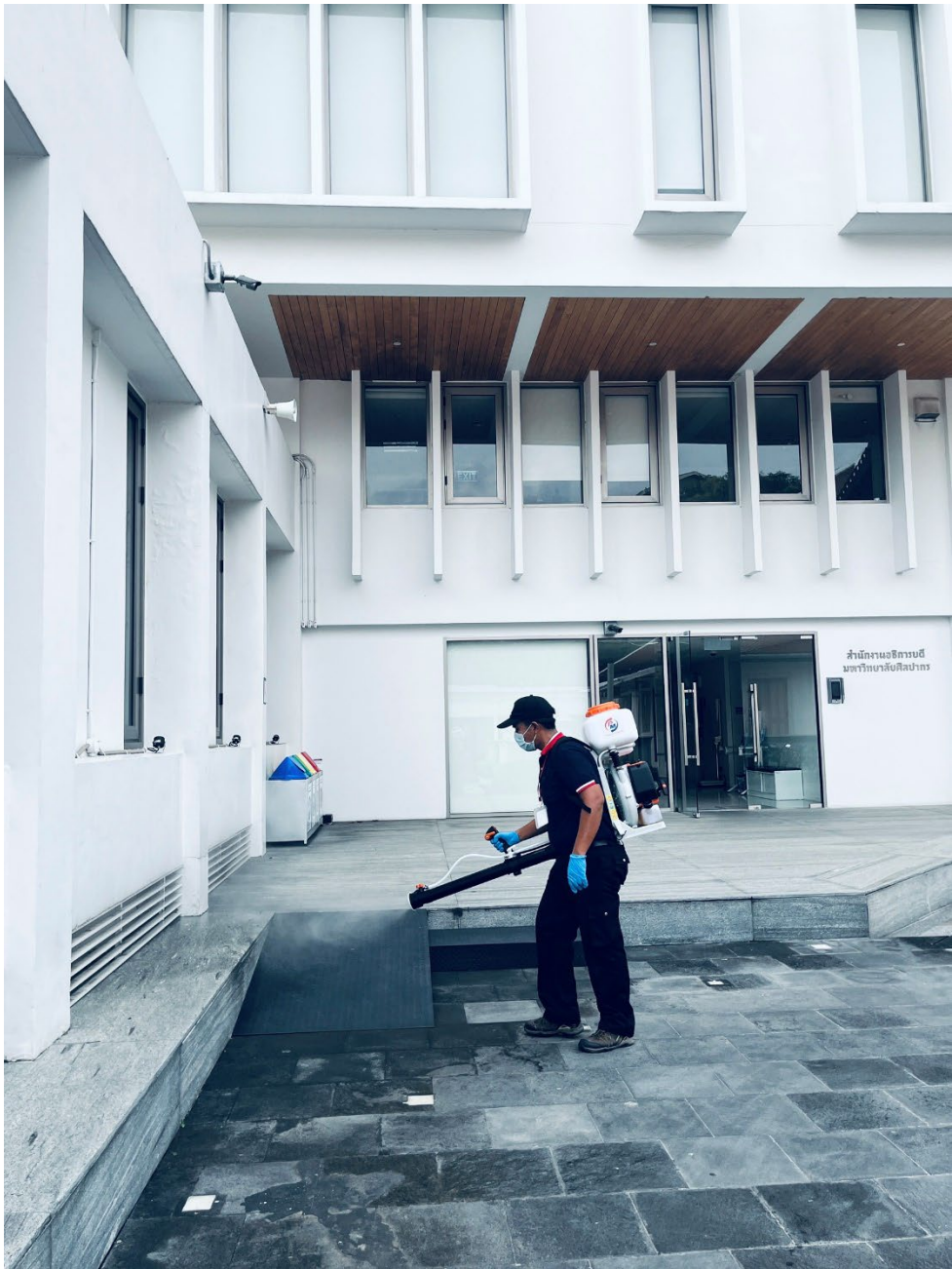
ภาพเจ้าหน้าที่จากบริษัทฯ กำลังฉีดพ่นน้ำยากำจัดยุงบริเวณด้านข้างหอสมุด