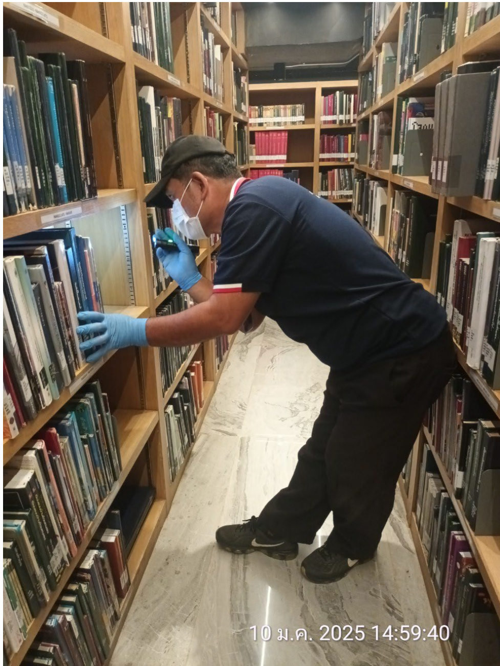
ภาพเจ้าหน้าที่จากบริษัทฯ กำลังส่องไฟهامอด มด แมลงทำลายหนังสือบริเวณชั้นหนังสือ