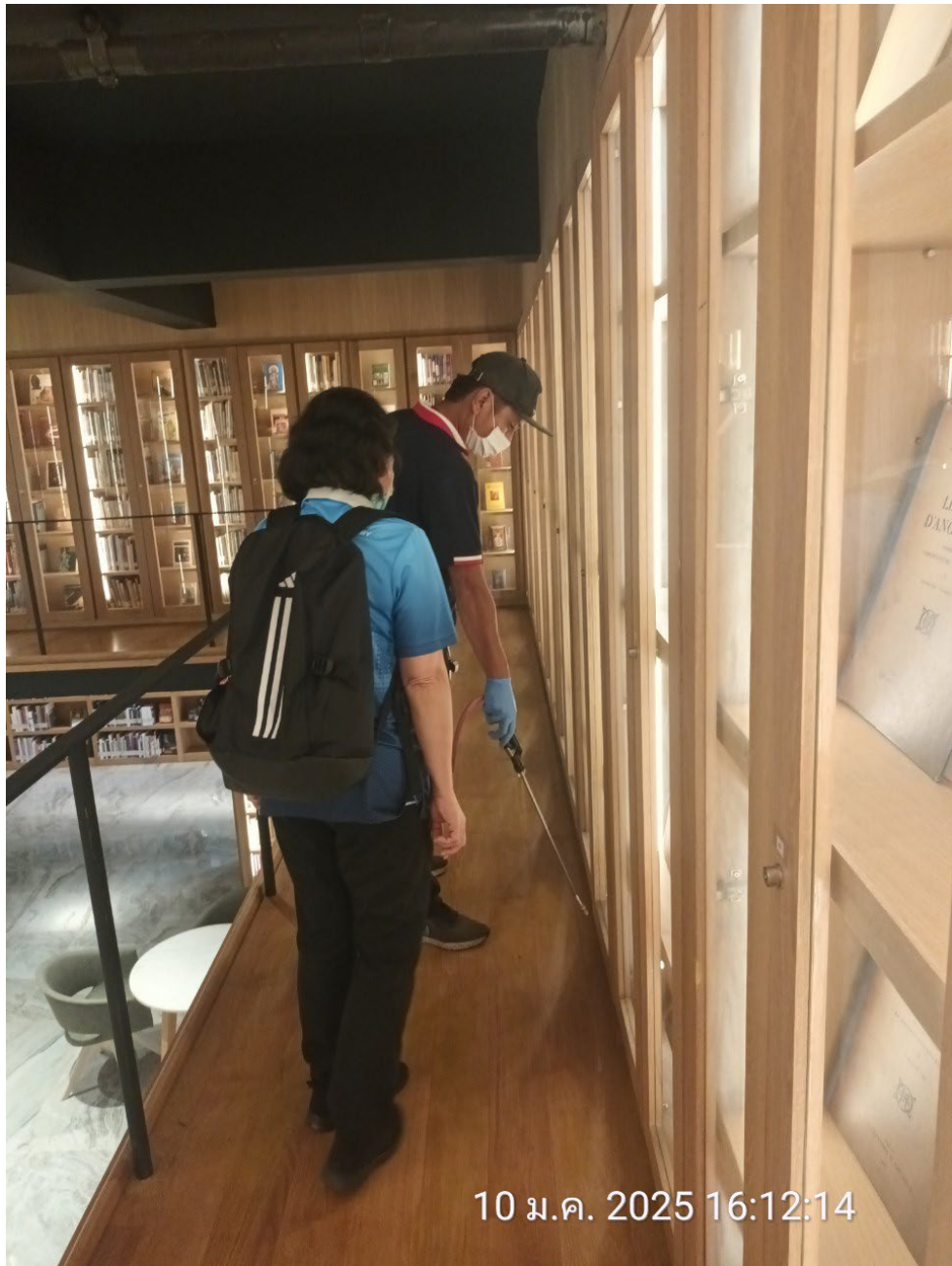
ภาพเจ้าหน้าที่จากบริษัทฯ ฉีดพ่นน้ำยากำจัดมอด มด แมลง บริเวณชั้น 2 ห้องสมุดศาสตราจารย์ หม่อมเจ้าสุภัทรีดิศ ดิศกุล