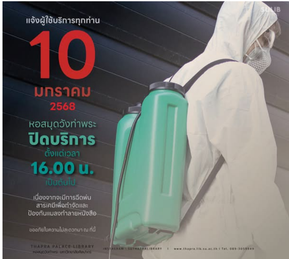
ภาพการประชาสัมพันธ์บน Facebook แจ้งให้ทราบว่าจะมีการฉีดพ่นสารเคมีกำจัดแมลงฯ