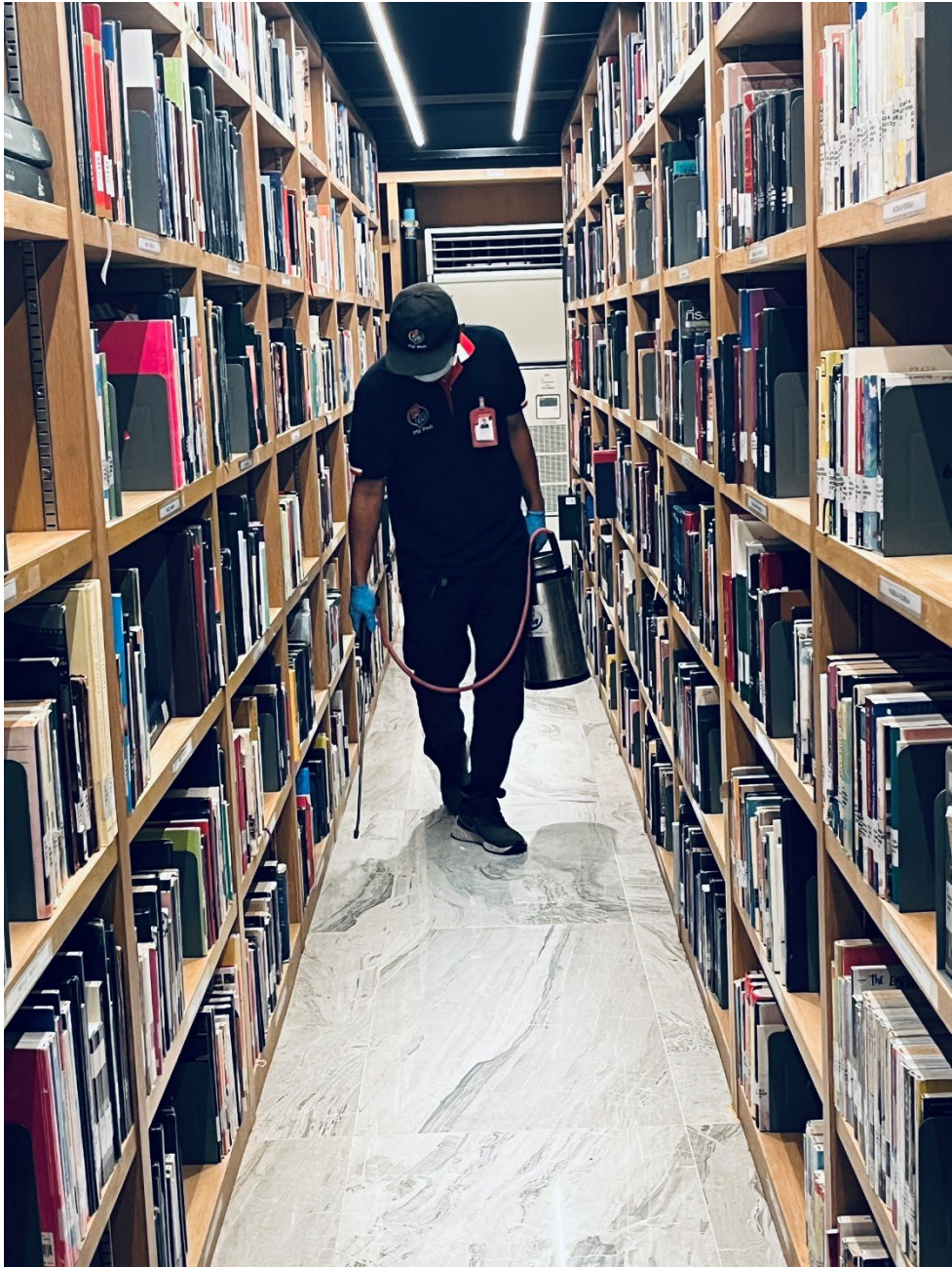
ภาพเจ้าหน้าที่จากบริษัทฯ กำลังฉีดพ่นน้ำยากำจัดมอด มด แมลง บริเวณตู้เก็บหนังสือ ชั้นใต้ดิน