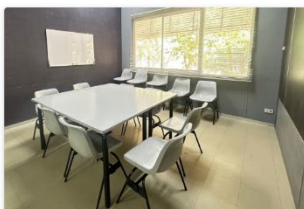
ห้องห้องพิเศษ 1

รองรับ 30 ที่นั่ง – จำนวนผู้ใช้งานได้ 10 ที่นั่ง – กระดาน – โทรทัศน์ประชุม – โปรเจกเตอร์ – ฉายบนผนัง (Wall Screen)