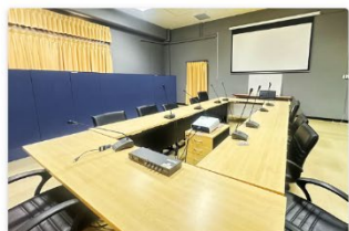
ห้องประชุมพิเศษ