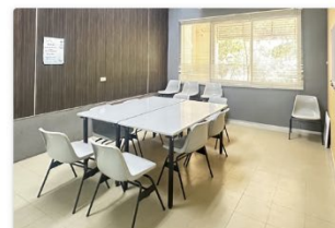
ห้องห้องพิเศษ 2