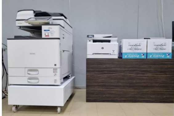
ภาพแสดงพฤติกรรมการใช้กระดาษ