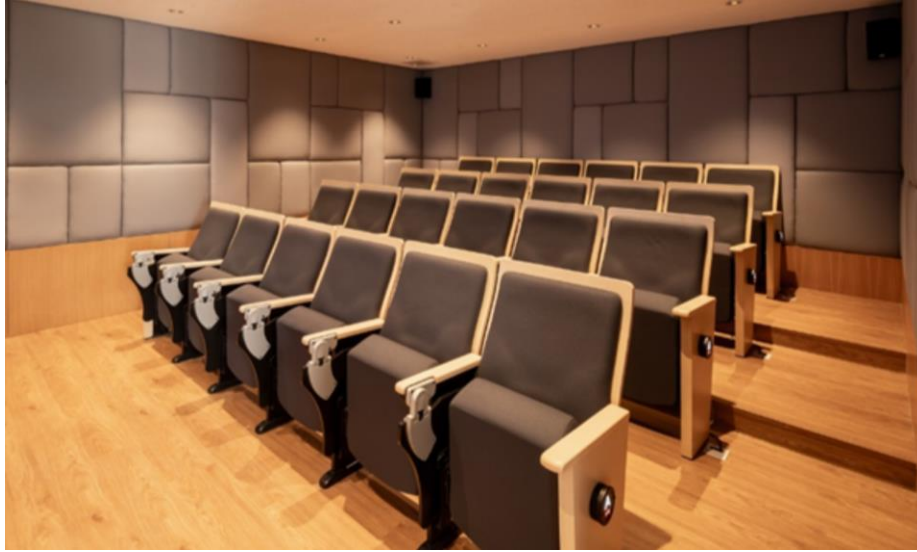
ภาพที่ 2 ห้องชมภาพยนตร์