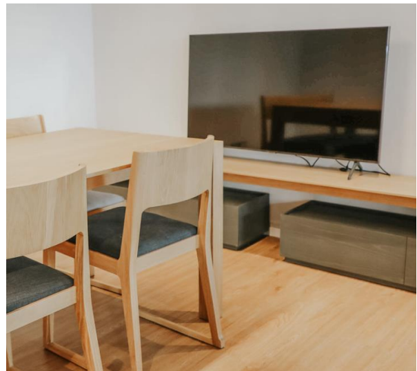
ภาพที่ 5 อุปกรณ์สำหรับการประชุมออนไลน์เพื่อลดการใช้กระดาษ

การจัดเตรียมอาหาร และเครื่องดื่มเป็นมิตรกับสิ่งแวดล้อม