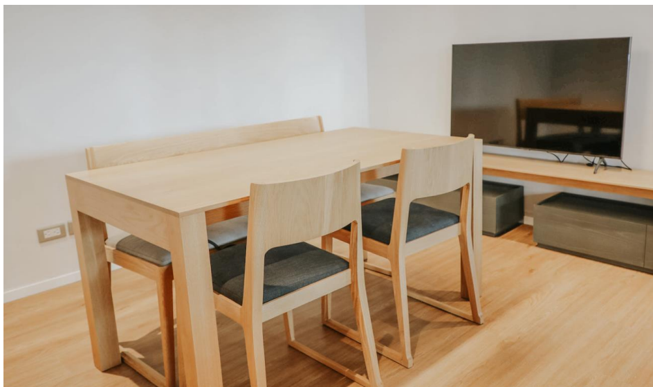
ภาพที่ 1 ห้องเรียนรู้อีกกลุ่ม

ภายในห้องประชุมของหอสมุดวังท่าพระไม่มีการตกแต่งหรือประดับด้วยวัสดุที่ย่อยสลายยาก หรือวัสดุที่ใช้ได้เพียงครั้งเดียว