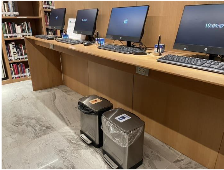
ภาพที่ 2 จุดทิ้งขยะชั้นใต้ดิน