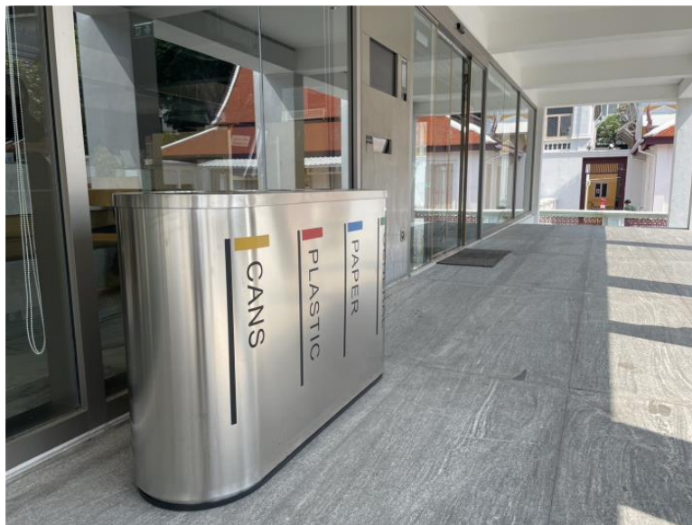
ภาพที่ 5 จุดทิ้งขยะภายนอกด้านหน้าหอสมุด