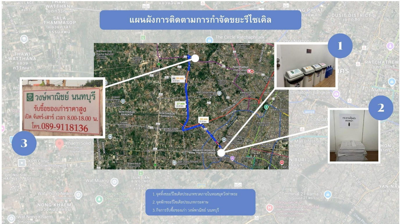
ภาพที่ 11 แผนผังการติดตามการจัดการขยะรีไซเคิล

2) ขยะรีไซเคิล ได้แก่ขวดน้ำ กระดาษ คณะกรรมการสำนักงานสีเขียว หอสมุดวังท่าพระมหาวิทยาลัย ศิลปากรได้เก็บรวบรวมไว้ ณ จุดพักและดำเนินการจำหน่ายไปยังกิจการรับซื้อของเก่า เช่น วงษ์พาณิชย์ เป็นต้น