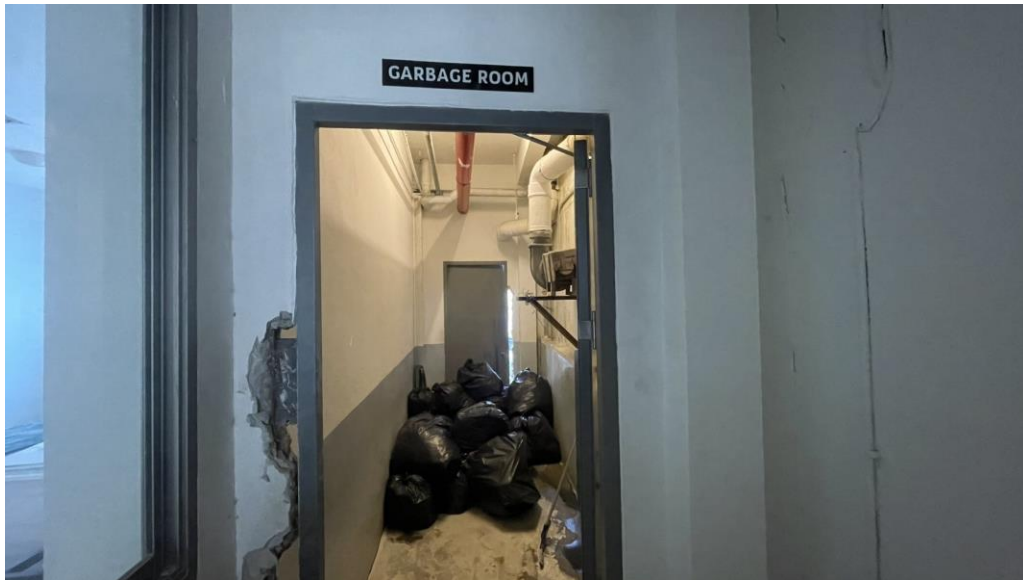
ภาพที่ 7 จุดพักขยะของมหาวิทยาลัยศิลปากร วิทยาเขตวังท่าพระ

หอสมุดฯ ดำเนินการคัดแยกขยะประเภทต่าง ๆ บรรจุในถุงดำที่ปิดมิดชิดป้องกันการรั่วไหล และนำไปพร้อมส่งกำจัดที่ห้อง Garbage Room ห้องสำหรับพักขยะของมหาวิทยาลัยศิลปากร วิทยาเขตวังท่าพระ เพื่อให้สำนักงานเขตพระนคร กรุงเทพมหานครดำเนินการต่อไป