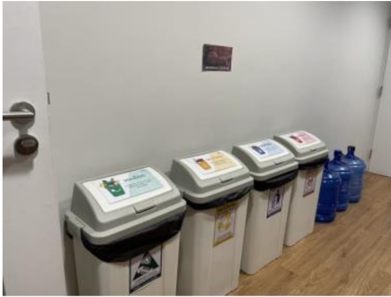
ภาพที่ 6 การติดป้ายบ่งบอกประเภทขยะ

หอสมุดวังท่าพระ มหาวิทยาลัยศิลปากร จัดทำป้ายประชาสัมพันธ์รณรงค์และให้ความรู้เพื่อบุคลากรได้มีส่วนร่วมในการคัดแยกขยะอย่างถูกวิธี รวมถึงการใช้ข้อมูลที่ถูกต้องและชัดเจน โดยติดตั้งในทุกจุดทิ้งขยะในความรับผิดชอบของหอสมุด