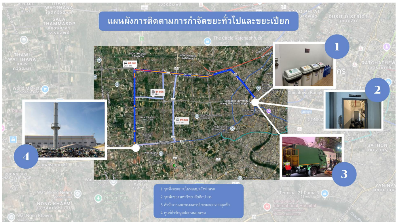
ภาพที่ 10 แผนผังการติดตามการกำจัดขยะทั่วไปและขยะเปียก

(ข้อมูลจากการสัมภาษณ์ ฝ่ายรักษาความสะอาดและสวนสาธารณะ สำนักงานเขตพระนคร โทร 02-224-3157)