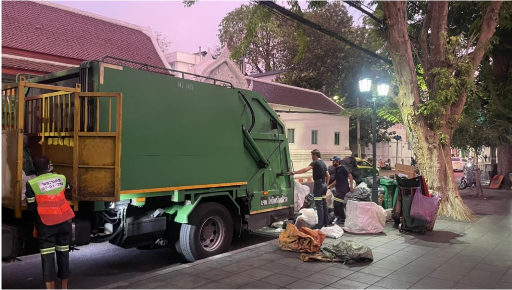
ภาพที่ 9 สำนักงานเขตพระนครดำเนินการจัดการขยะ

ขยะภายในมหาวิทยาลัยศิลปากร วิทยาเขตวังท่าพระ ถูกขนย้ายจากจุดพักเพื่อกำจัดอย่างถูกวิธีภายใต้การดำเนินงานของฝ่ายรักษาความสะอาดและสวนสาธารณะ สำนักงานเขตพระนคร กรุงเทพมหานคร