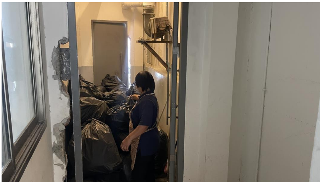
ภาพที่ 8 ขยะบรรจุในถุงดำที่มิดชิดอย่างมิดชิดและนำมายังจุดพัก