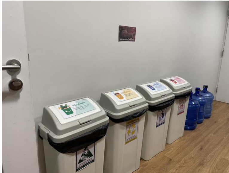
ภาพที่ 4 จุดทิ้งขยะชั้น 4