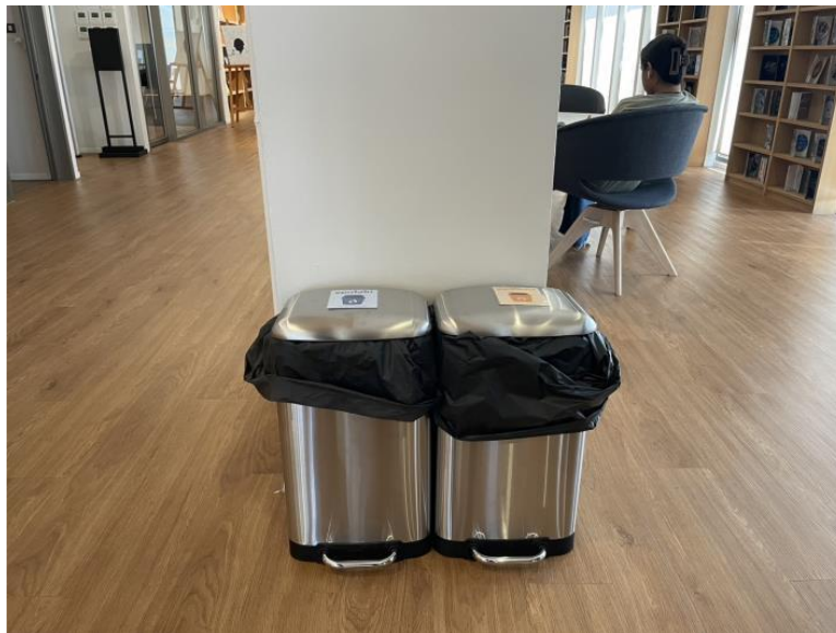
ภาพที่ 3 จุดทิ้งขยะชั้น 3