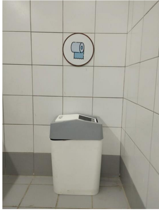
ด้านในอาคารหม่อมหลวง ปิ่น มาลากุล สำหรับห้องน้ำผู้ให้บริการ ชั้น 1 และ ชั้น 5