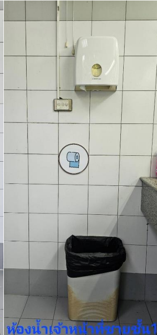
ห้องน้ำเจ้าหน้าที่หญิงชั้น 1