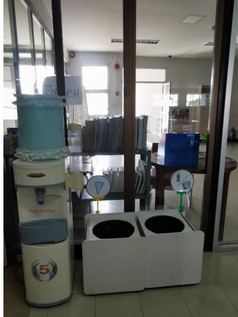
ด้านในอาคารหอสมุดพระราชวังสนามจันทร์ สำหรับห้องน้ำผู้ให้บริการ ตั้งแต่ชั้น 2-4