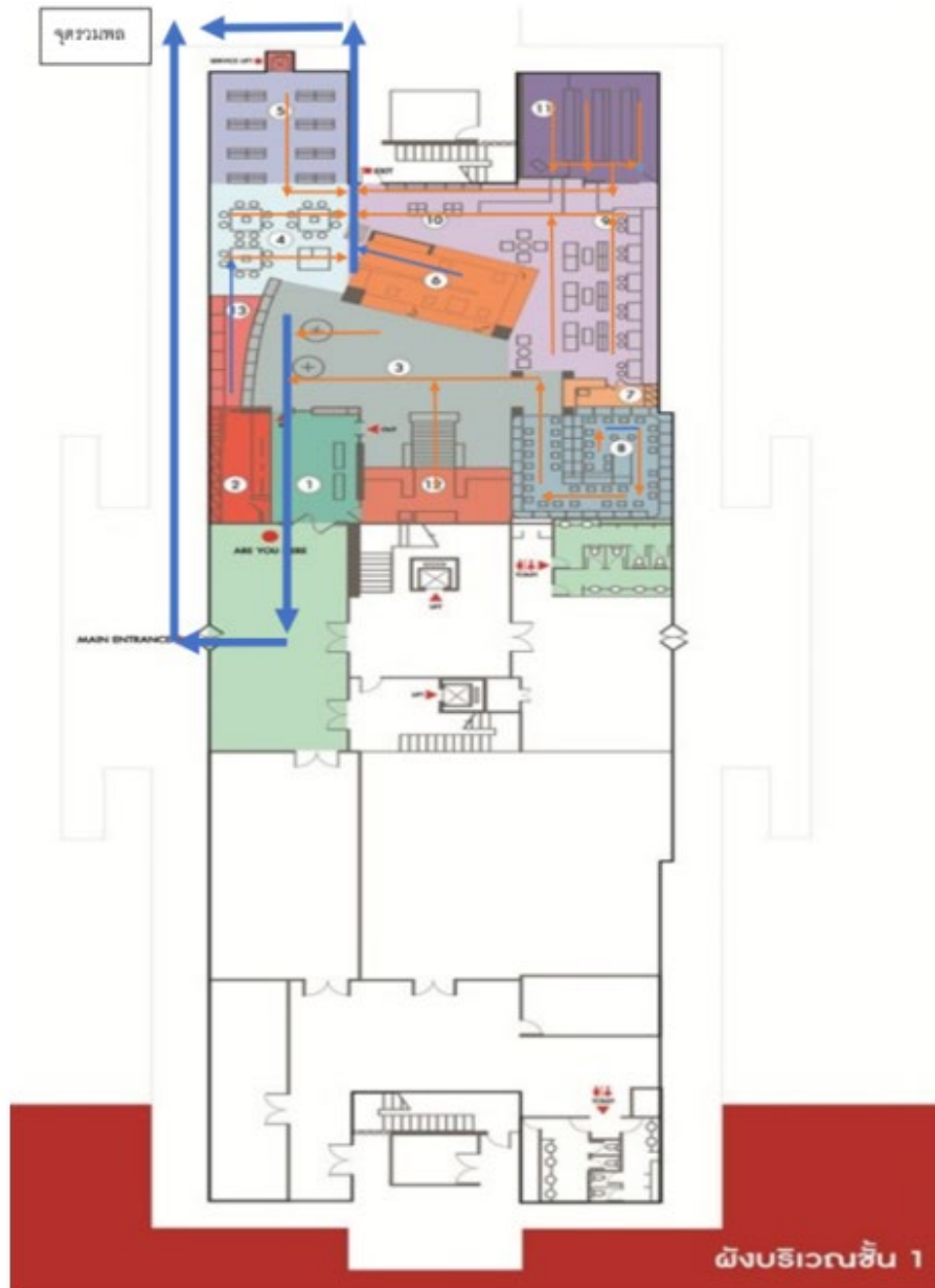
อาคารวิทยบริการ (ชั้น 1)