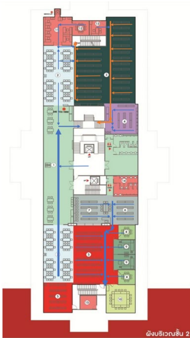
อาคารวิทยบริการ (ชั้น 2)