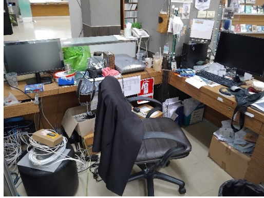
ภาพหลัง ทำ 5 ส ฝ่ายหอสมุดวิทยาเขตสารสนเทศเพชรบุรี