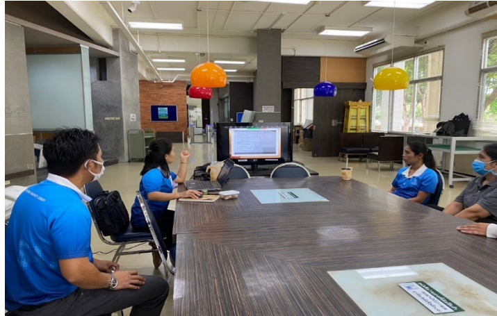
ภาพก่อนทำ 5 ส ฝ่ายหอสมุดวิทยาเขตสารสนเทศเพชรบุรี

ฝ่ายหอสมุดวิทยาเขตสารสนเทศเพชรบุรี สำนักหอสมุดกลาง มหาวิทยาลัยศิลปากร มีการมี การกำหนดเวลาในการดูแลรักษา ความสะอาดและความเป็นระเบียบเรียบร้อย ทั้งพื้นที่เฉพาะและพื้นที่ทั่วไป เช่น เวลาการทำความสะอาดแต่ละพื้นที่ เวลาในการรดน้ำต้นไม้ เป็นต้น ทั้งนี้มีการจัดกิจกรรม 5 ส บริเวณภายใน อาคารหอสมุดวิทยาเขตสารสนเทศเพชรบุรี ชั้น 1 และชั้น 2 เพื่อดูแลรักษาความสะอาด และความเป็นระเบียบ เรียบร้อย ทั้งพื้นที่เฉพาะ และพื้นที่ทั่วไป เมื่อวันที่ 21 มิถุนายน 2567