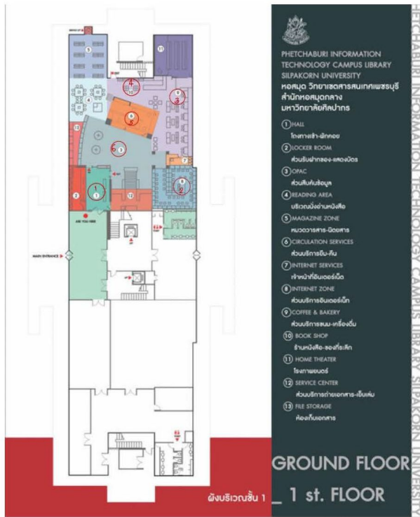
ผังแสดงจุดตรวจวัดระดับความเข้มของแสงสว่างพื้นที่ชั้น 1