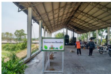
เตาเผาขยะไร้มลพิษ