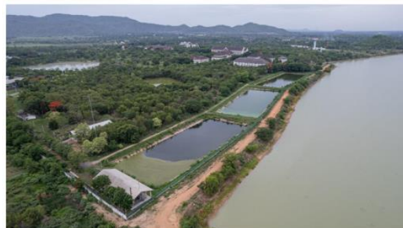
ระบบบำบัดน้ำเสีย