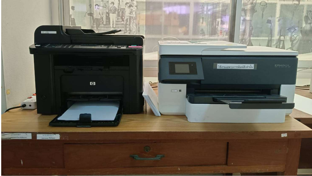
ภาพที่ 1 ใช้เครื่องพิมพ์ร่วมกันผ่านระบบเครือข่าย โดยแยกเครื่องพิมพ์แบบ 4 สี กับเครื่องพิมพ์แบบสีเดียว (ขาว-ดำ)