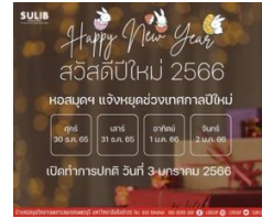
การปิดให้บริการช่วงปีใหม่ ของหอสมุดทั้ง ๓ วิทยาเขต