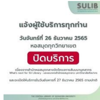
แจ้งปิดบริการ