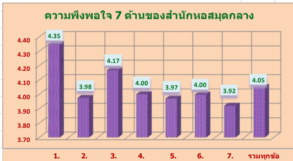
แผนภูมิ 2 แสดงภาพรวมระดับความพึงพอใจของผู้ใช้บริการต่อหอสมุดจำแนกเป็นรายชื่อ